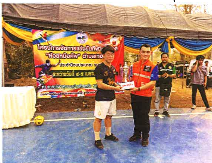
รางวัลรองชนะเลิศอันดับที่ 2 ทีม เก้าหลังFC