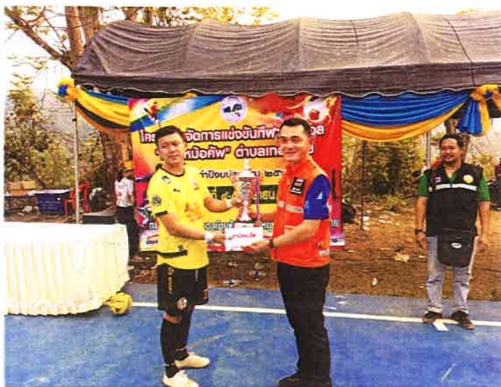
รางวัลรองชนะเลิศอันดับที่ 1 ทีม เสี้ยไก่อั้งลุย