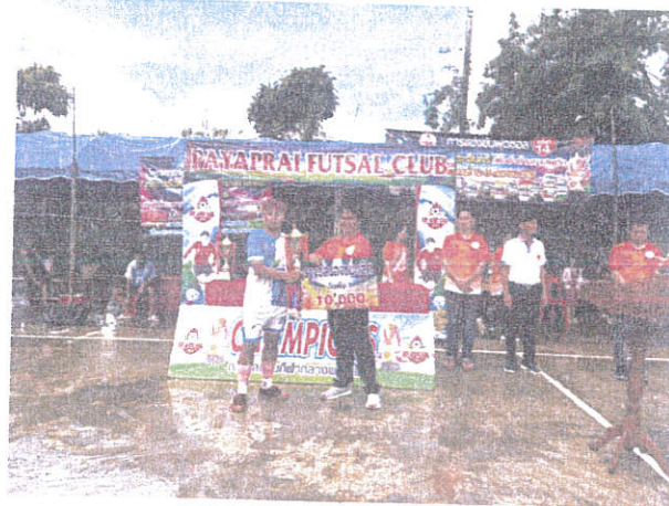
ชนะเลิศลำดับที่ ๓ ทีม พญาไพร B