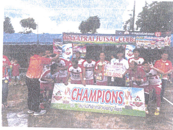
ชนะเลิศลำดับที่ ๒ ทีม โรงงานชาอานเย